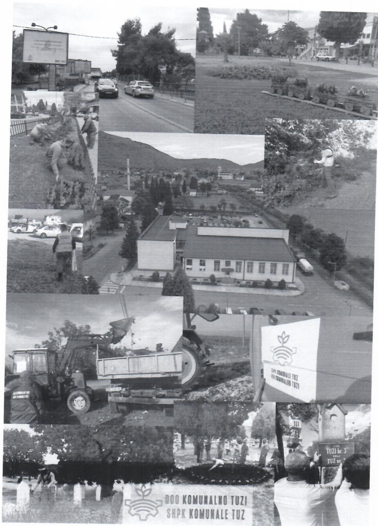
Përshkrim fotografik sh.p.k “Komunalno/Komunale” - Tuz