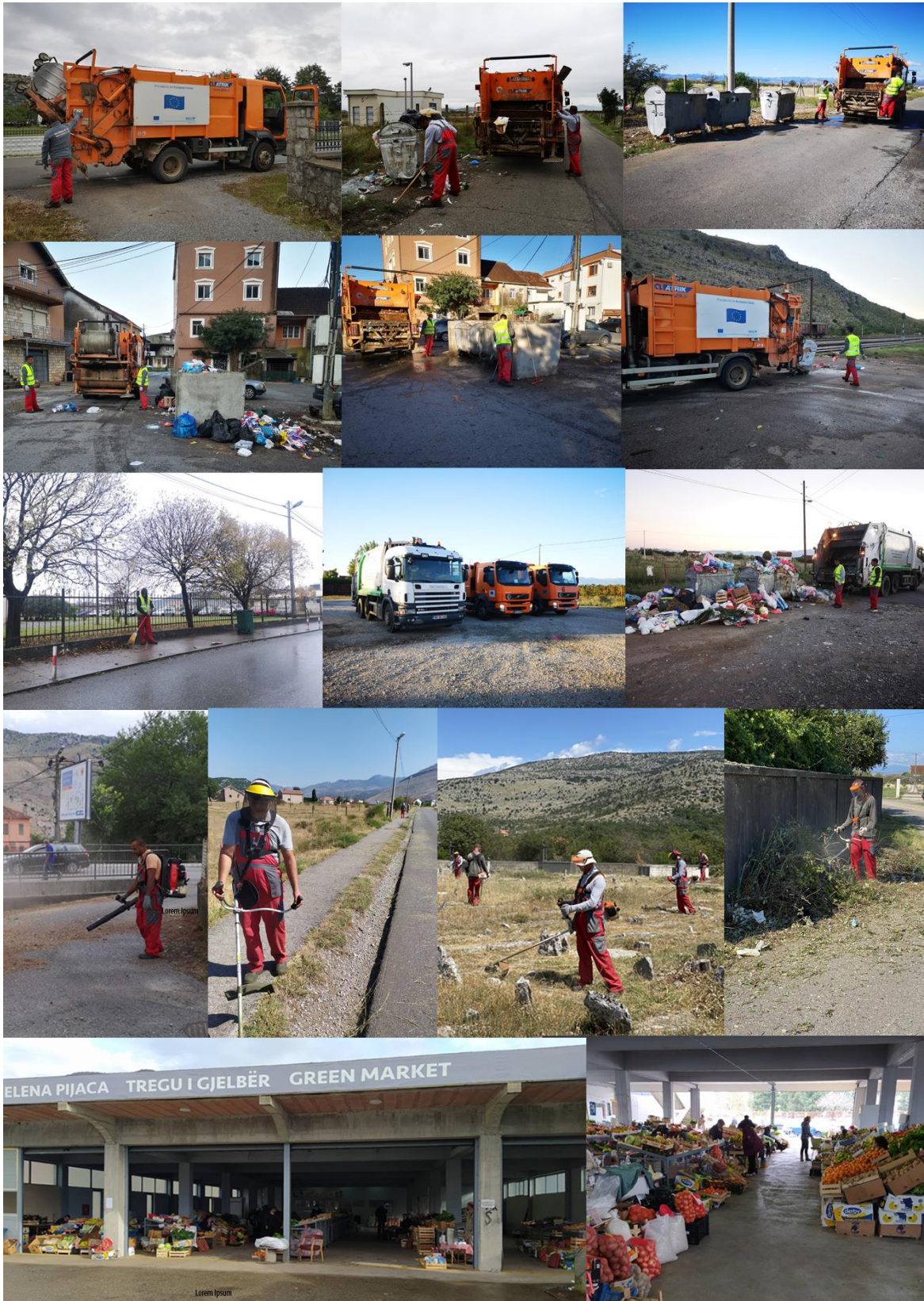
Përshkrim fotografik sh.p.k “Komunalno/Komunale” - Tuz